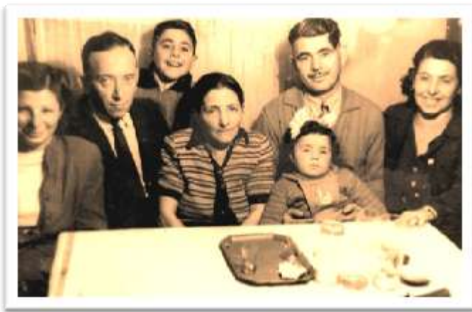
משפחת אימי בבר מצווה

הייתי מאד גאה בעצמי על שהצלחתי לשכנע את הורי לערוך את הטקס, גם בבית הכנסת וגם בביתי, וזאת למרות הפשטות של הטקס ומיעוט המשתתפים. אני הרגשתי התרוממות רוח ומעין הגשמת חלום