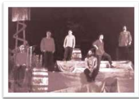
אני במופע היובל ( במרכז התמונה )