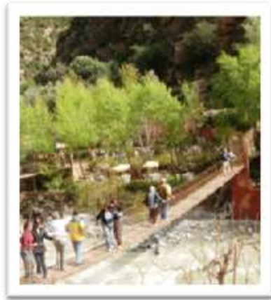
מעבר על הגשר מעל הנחל

לאחר כשעתיים וחצי של הליכה מאומצת ותוך סכנה ממשית (לא ניתן היה לבקש עזרה כי לא הייתה קליטה בהרים לטלפונים הסלולאריים), ותוך כעס עצום, הגענו לגשר המדובר. אך על כך אומרים חכמינו: "מה שלא הורג מחשל".