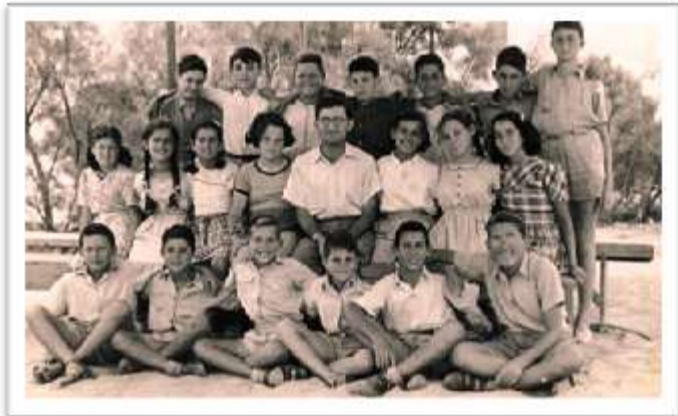
כתה ו' בבית הספר תחכמוני בבת-ים ( אני יושב בשורה התחתונה שני משמאל)

נרשמתי לבית הספר הדתי בבת-ים "תחכמוני", והתקבלתי לכתה ד'. בבית ספר זה למדתי שנתיים, ובו התחלתי את הקשר שלי עם משחק הכדורגל. מה שעוד זכור לי מאותה תקופה הנה העובדה שלמדתי ביחד עם ילדי גוש עציון שביתם הארעי היה גם כן בגבול בת-ים. ילדי גוש עציון פונו בינואר 1948 לירושלים ולאחר מלחמת השחרור שוכנו ארעית בגבול בת-ים-גבעת עליה.