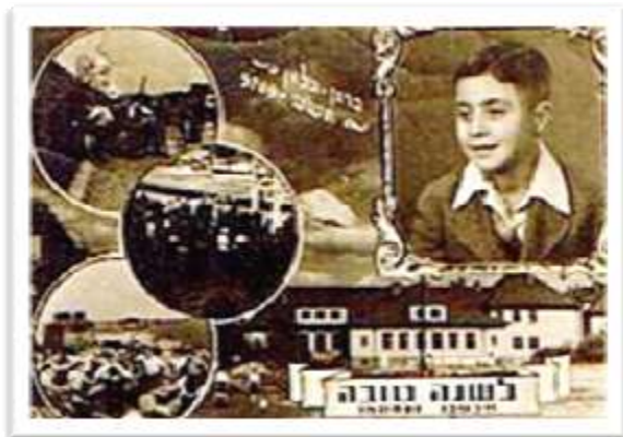
תמונה למזכרת ממחנה ברגן-בלזן בגרמניה

במשך שלוש השנים ששהינו בגרמניה, למדנו עברית והוכנו לעלייה לארץ. אני כילד הייתי מוקסם מהרעיון של העלייה וחיכיתי לו בכליון עיניים.