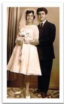
אנחנו בסטודיו לפני החופה