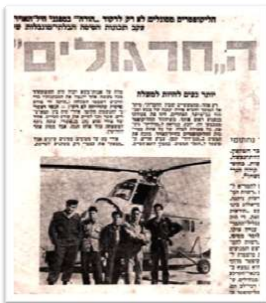
הטייס בני ושלושה מכונאים מוטסים על רקע מסוק סיקורסקי 55) אני השלישי מימין)