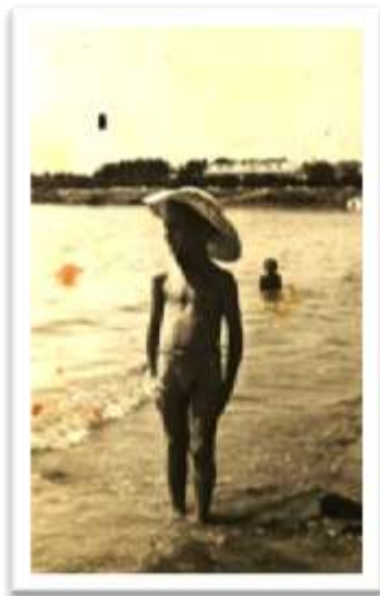
אני בחופשה בקוסטנצה