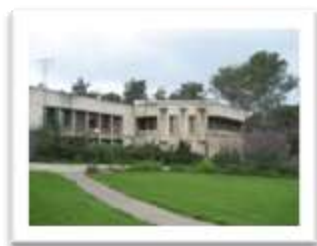
חדר האוכל בקיבוץ נחשון

שהיינו בקיבוץ נחשון כמעט שנתיים. החיים בקיבוץ מצאו חן בעינינו, אך הלינה בבתי הילדים של ילדינו, קשה היה לנו וגם להם לקבלה. חפשנו פתרון קיבוצי במקום אחר.