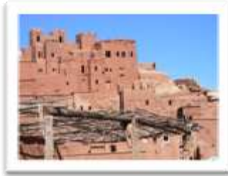
הקסבה " איית אל חאדו"

ב-9 במרץ בבוקר הגענו בהרי האטלס לביקור בקסבה (מצודה) מפורסמת בשם "איית אל חאדו", בה צולמו חלק מהסרטים: אוצר הנילוס, קזבלנקה ולורנס איש ערב.