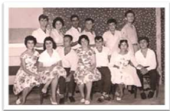
יום חתונתנו עם חברים