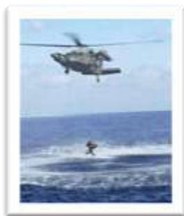
הצלה בלב ים