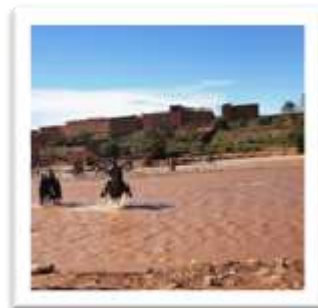
מעבר הנחל על חמורים

על מנת להגיע לקסבה היה עלינו לעבור נחל שבדרך כלל עוברים אותו ברגל יחפה. אולם כשהגענו לשם נתקלנו בנחל זורם כשגובה המים הגיע עד הברכיים וניתן היה לעבור אותו רק בעזרת חמורים או פרדות, בתשלום סמלי.