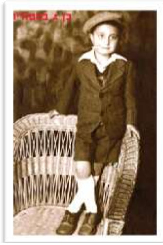
בן 4 בטודיו

ברומניה חייתי את חמש השנים הראשונות של חיי. הן היו מאד אינטנסיביות ומשמעותיות, אך מפאת גילי הצעיר, איני זוכר מהם הרבה ורק "ניצוצות", פה ושם.