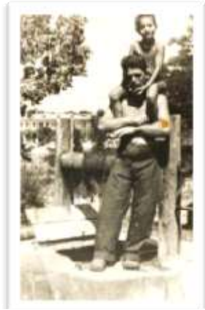
אני עם אבא בקוסטנצה

ארבעת הימים חלפו מהר מאד, והגיע זמן פרידה. מבלי שהרגשנו הזמן אזל לנו. הפרידה הייתה קשה ואף הביאה לידי בכי, אך מה לעשות זה גיל בו ההורים שולטים במעשנו.