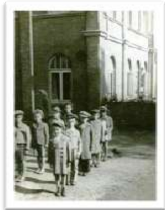
בית הספר בגרמניה – אני ראשון משמאל