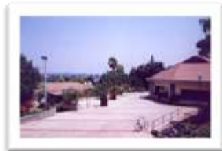
חדר האוכל החדש והרחבה בשילר