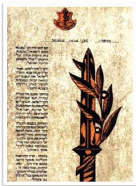
תעודת שחרור חתומה על ידי ראש אכ"א

בשנת 1991, ואני כבר בן 52 שנה, החלטתי שזה סוף הפרק הביטחוני שלי ובקשתי להשתחרר. באוגוסט אותה שנה שוחררתי מצ.ה.ל לאחר שרות של 32 שנים, מהן 5 בסדיר וקבע ו- 27 במילואים.