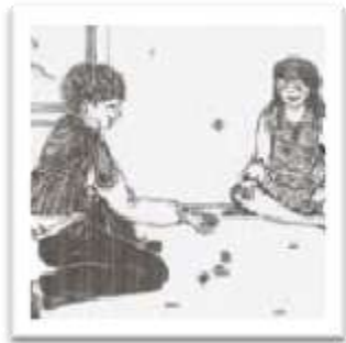
משחק 5 אבנים

המזון באותם ימים היה דל, והמזון הזכור לי ביותר מאותם ימים היה לחם שחור קשה (הנשיקה) ועליו מרוח שום. מזון נוסף של אותם ימים היו כדורי הלחם המטוגנים. אימי הייתה אוספת את שאריות הלחם, מרטיבה אותם, לשה ומכינה מהם קציצות. איני יודע איך, אך היא השיגה שמן אווז עם חתיכות עור(גריבן), ומטגנת את כדורי הלחם בתוך השומן הזה. הדבר היה הופך למעדן וטעמו נשאר עימי עד היום. מאכל נוסף שנשאר בזיכרוני אינו קשור למשפחתי, אלא ללוויות בבתי הקברות של הנוצרים. בכל לוויה כזו היו המלווים מחלקים מזון מתקתק שנקרא "קוליבה", אנו הילדים היינו מתגנבים לתוך קהל המלווים ונהנים מהמזון הנהדר הזה. הטעם המתוק הזה נשאר בזיכרוני כדבר מופלא.