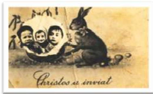
חג המולד הנוצרי (אני מצד ימין)

התקופה בה נולדתי היא תקופה מאוד משמעותית בחיי ובחיי העולם כולו - מלחמת העולם השנייה. ב-1 בספטמבר 1939 (ואני בן 8 חודשים) פלשה גרמניה לפולין ופתחה בזה את מלחמת העולם השנייה.