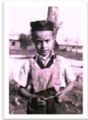
בחדר בעיר מינץ-אוסטריה

במסגרת שהותנו במחנה, התחלתי ללמוד בחדר במסגרת אורתודוקסית כי סידור אחר לא היה.