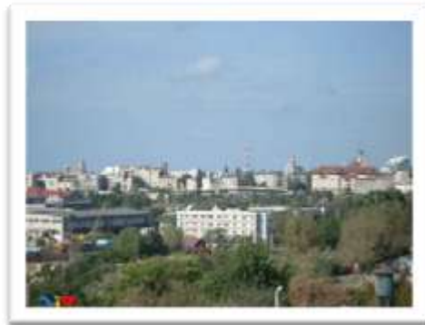
העיר קוסטנצה לחוף הים השחור

היה זה בשנת 1944, לאחר כניסת הרוסים לרומניה (טרם נכנסו לבוקרשט), ובריחת הנאצים ועוזריהם. הורי, עשו הכנות ליציאה מרומניה (אבי היה ברשימה השחורה של הקפיטליסטים), והחליטו להיפרד מרומניה בצורה מיוחדת, ביציאה לחופשה בת ארבעה ימים בעיר הנופש שלחוף הים השחור-קוסטנצה.